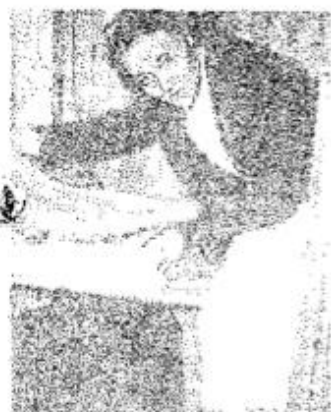
Dette er garderoben for sengetøy for kvinneavdelingen, som har 93 pasienter