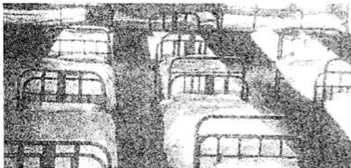
Dette bildet gir et lite inntrykk av hvor forferdelig overbefolket Tokerud er. Sengene er plassert så tett som de i det hele tatt kan stå, også under vinduene, som i beste fall er utstyrt med hasper så de kan lukkes skikkelig.