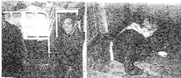
Et av soveværelsene i en av de nyeste bygningene, som er noe bedre enn de andre. Guttene på gulvet kan ikke gå, men kryper omkring