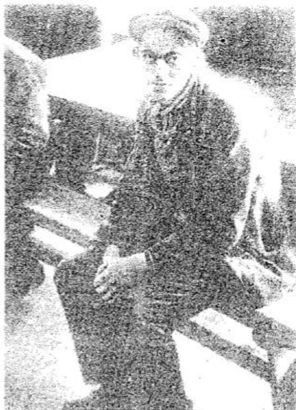
Et bilde av tristhet og håpløshet. Sløve og apatiske og med tomme blikk sitter pasientene på de slitte trebenkene i oppholdsrommet, hvor ingenting er gjort for å skape litt hygge

kan klare å holde pasientene rene med ett bad! En sånn luksus som innlagt vann fins ikke i de fleste rommene på denne avdelingen. Det må bæres lange veier. Det samme gjelder flere av de andre bygningene.